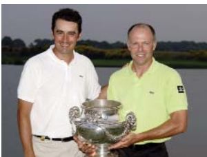
DOUBLÉ HISTORIQUE À L'OPEN DE FRANCE 2005 LACOSTE CHAMPIONS AT 2005 FRENCH OPEN