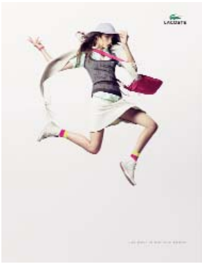
NOUVELLE CAMPAGNE DE PUB LACOSTE LACOSTE NEW ADVERTISING CAMPAIGN