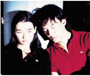
RÉALISATION DU FILM PUBLICITAIRE PAR LE RÉALISATEUR WONG KAR WAI. Film Commercial by director Wong Kar Wai