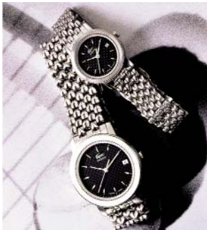
MONTRES LACOSTE. Lacoste watches