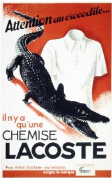
PUBLICITE CROCODILE 1937 Crocodile Advertising 1937