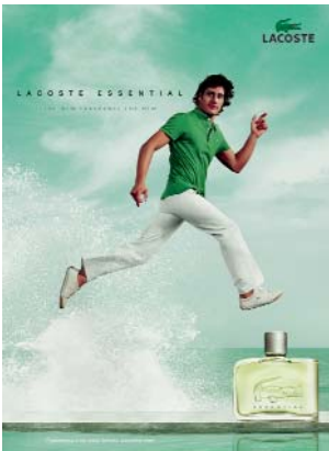
PUBLICITÉ ESSENTIAL ESSENTIAL ADVERTISING