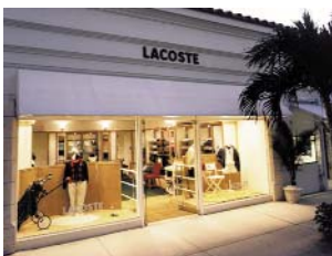
1995 : OUVERTURE DES PREMIÈRES BOUTIQUES AUX ETATS-UNIS, CI-DESSUS LA BOUTIQUE À PALM BEACH, EN FLORIDE. 1995: opening of the first Lacoste boutiques in the United States, here in Palm Beach.