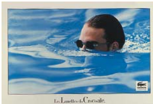
PUBLICITÉ POUR LES LUNETTES LACOSTE. Advertising for Lacoste sunglasses