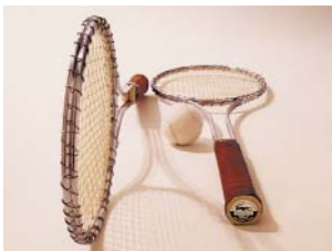
PREMIÈRE RAQUETTE DE TENNIS EN ACIER, 1963. First steel tennis racket, 1963