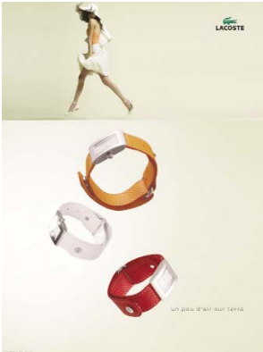
PUBLICITÉ MONTRES WATCHES ADVERTISING