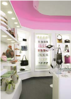
NOUVEAU CONCEPT DE BOUTIQUE DUTY FREE INTERNATIONAL ACCESSORIES TRAVEL RETAIL CONCEPT STORE