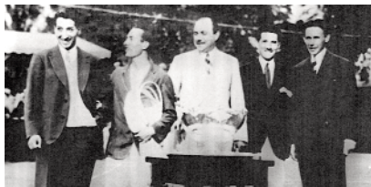
LES MOUSQUETAIRES The Musketeers

Cette chemise constitua immédiatement une révolution chez les joueurs de tennis de l'époque, qui portaient alors sur les courts des chemises de ville classiques en tissu chaîne et trame, à manches longues. La première chemise LACOSTE était blanche, légèrement plus courte que ses contemporaines, à manches courtes et col bord-côtes, et son tissu léger et aéré en maille n'était autre que le "jersey petit piqué". Ses qualités de confort et de solidité se retrouvent de nos jours dans toute leur intégrité et en font un produit différent et unique.