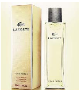
PUBLICITÉ MAGAZINE "LACOSTE POUR FEMME" Press Advertising "Lacoste Pour Femme"