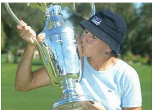
VICTOIRE AU KRAFT NABISCO CHAMPIONSHIP Victory at the Kraft Nabisco Championship