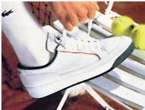
CHAUSSURES DE TENNIS LACOSTE Lacoste tennis shoes