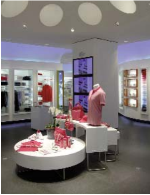
NOUVEAU CONCEPT BOUTIQUE LACOSTE. New LACOSTE Boutique concept.