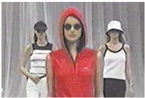
DÉFILÉ COLLECTION PRINTEMPS/ÉTÉ 2002. Fashion show for the Spring/Summer 2002 collection