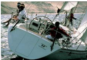
LE BATEAU LACOSTE 42 The Lacoste boat 42