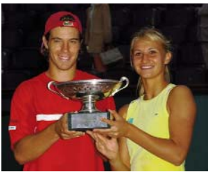
TATIANA GOLOVIN ET RICHARD GASQUET TATIANA GOLOVIN AND RICHARD GASQUET