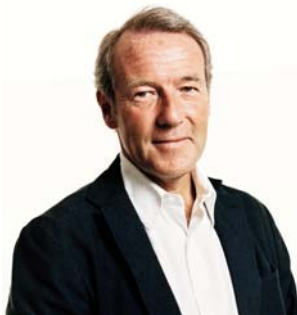
CHRISTOPHE CHENUT

La marque fête tout au long de l'année son 75ème anniversaire.