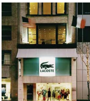
BOUTIQUE LACOSTE MADISON AVENUE. Madison Avenue LACOSTE Boutique.