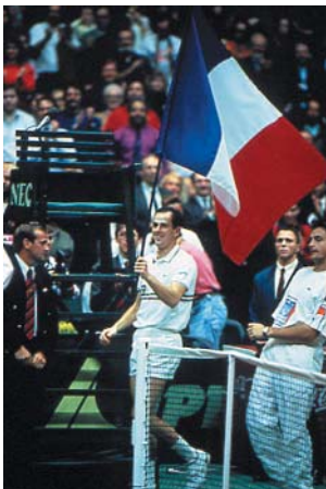
1991 : L'ÉQUIPE DE FRANCE REMPORTE LA COUPE DAVIS. 1991: the French team wins the Davis Cup