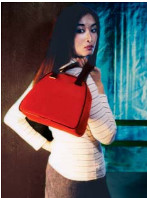
PUBLICITÉ POUR LA MAROQUINERIE LACOSTE. Advertising for Lacoste leather goods