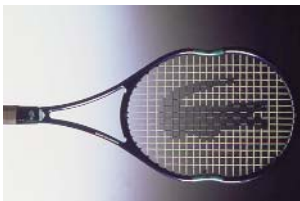
RAQUETTE EQUIJET. Equijet racket