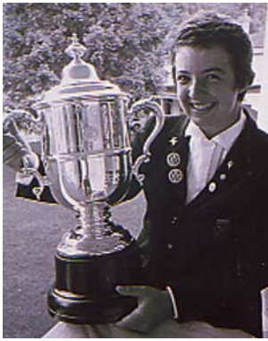
CATHERINE LACOSTE DEVIENT CHAMPIONNE DU MONDE DE GOLF À 19 ANS. Catherine Lacoste becomes world golf champion at 19 years-old