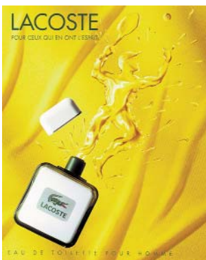
PUBLICITÉ POUR L'EAU DE TOILETTE POUR HOMME LACOSTE. Advertising for the Lacoste Eau de toilette for men