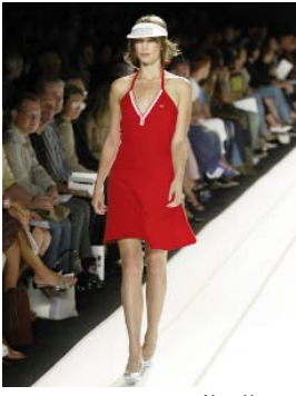
PREMIER DEFILE LACOSTE A NEW YORK First LACOSTE defile in New York