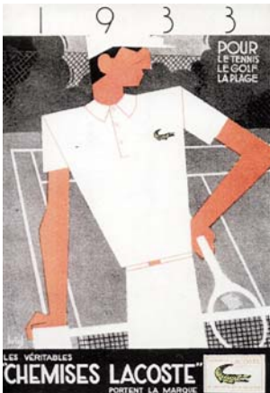
PREMIÈRE PUBLICITÉ, 1933. First advertising, 1933

FROM 1933 TO THE PRESENT, A FEW KEY DATES TRACE THE PROGRESS OF THE LACOSTE BRAND: