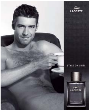
PUBLICITÉ MAGAZINE "LACOSTE POUR HOMME" Press Advertising "Lacoste Pour Homme"