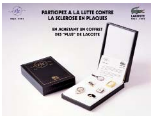
OPERATION SCLEROSE EN PLAQUES Multiple Sclerosis Campaign